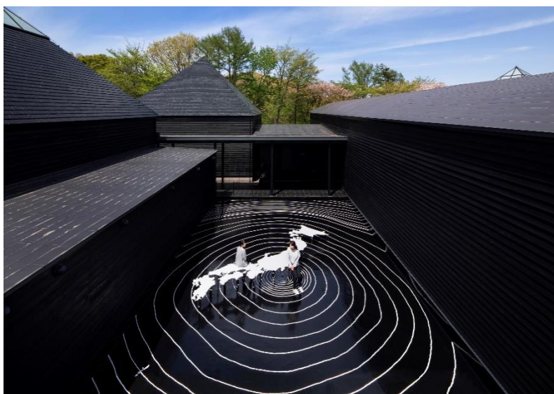
1. 鈴木康広「日本列島のベンチ」 2014/2021 作 ミクストメディア、サイズ可変