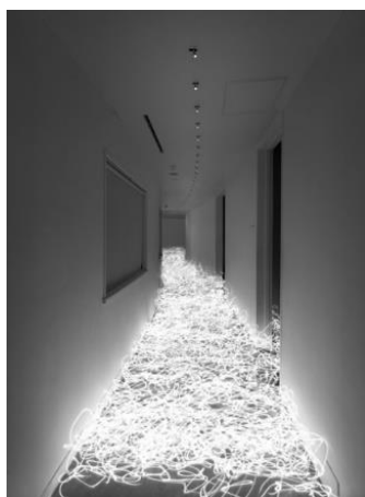
(4) 作家名:佐藤時啓 作品名:光一呼吸 Harabi#9 素材等:ピグメントプリント 197×150cm 制作年:2020年