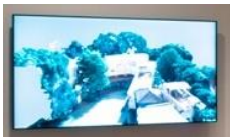
(8)作家名:佐藤時啓 作品名:『「こんな夢をみた」一親指と人さし指は、 網目のすき間の旅をする一』 素材等:映像 制作年:2020年