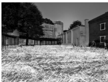
(1) 作家名:佐藤時啓 作品名:光一呼吸 Harabi#1 素材等:ピグメントプリント 150×197cm 制作年:2020年