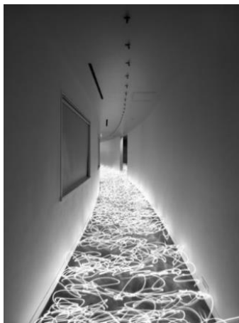
(3) 作家名:佐藤時啓 作品名:光一呼吸 Harabi#8 素材等:ピグメントプリント 197×150cm 制作年:2020年