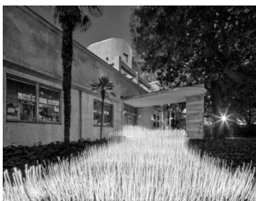
(2) 作家名:佐藤時啓 作品名:光一呼吸 Harabi#2 素材等:ピグメントプリント 150×197cm 制作年:2020年