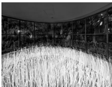
(1) 作家名:佐藤時啓 作品名:光一呼吸 Harabi#5 素材等:ピグメントプリント 111.5×146cm 制作年:2020年