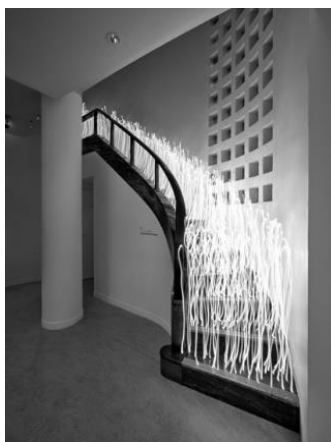
(2) 作家名:佐藤時啓 作品名:光一呼吸 Harabi#7 素材等:ピグメントプリント 197×150cm 制作年:2020年