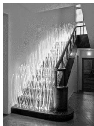
(5) 作家名:佐藤時啓 作品名:光一呼吸 Harabi#6 素材等:ピグメントプリント 197×150cm 制作年:2020年