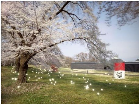
(7)作家名:佐藤時啓 作品名:光一呼吸 HaraArc#3 素材等:ピグメントプリント 50×60cm 制作年:2020年