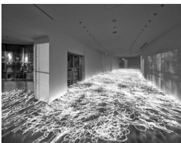
(4) 作家名:佐藤時啓 作品名:光一呼吸 Harabi#4 素材等:ピグメントプリント 150×197cm 制作年:2020年