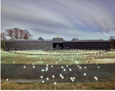
(5)作家名:佐藤時啓 作品名:光一呼吸 HaraArc#1 素材等:ピグメントプリント 111.5×146cm 制作年:2020年