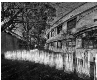
(3) 作家名:佐藤時啓 作品名:光一呼吸 Harabi#3 素材等:ピグメントプリント 150×197cm 制作年:2020年